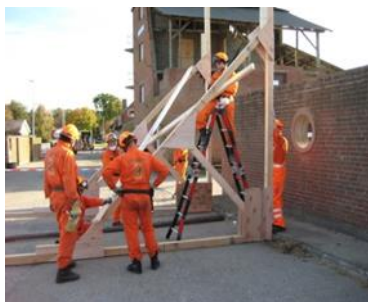
Figura 3: Equipo operando en el ejercicio de IEC de 36 horas de duración.