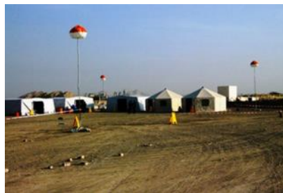
Figura 6: Una base de operaciones del equipo USAR.