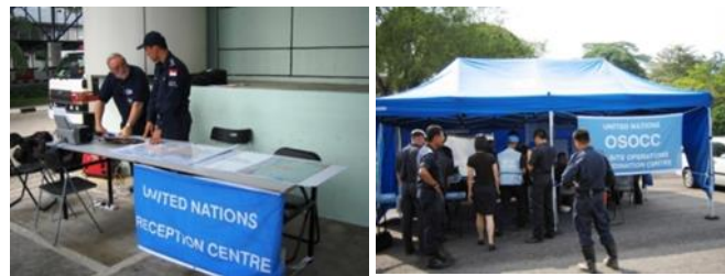
Figura 5: RDC y OSOCC provisionales establecidos durante un ejercicio de la IER.