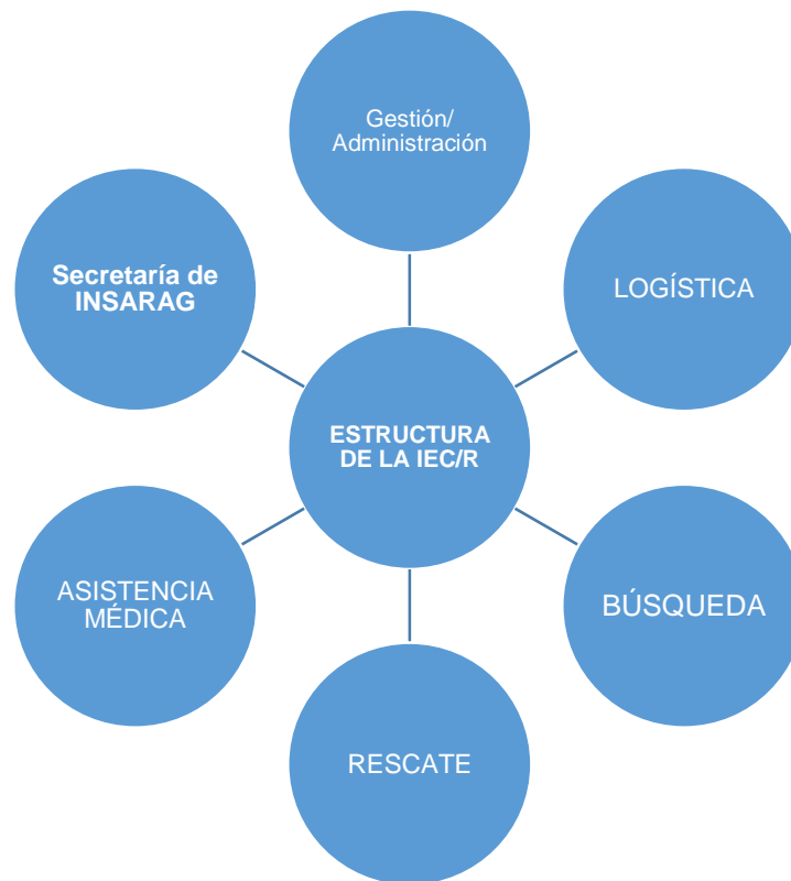
Figura 2: Experiencia técnica de la estructura de IEC/R en la evaluación de un equipo USAR.

La cantidad mínima de los clasificadores requeridos para una IEC es la siguiente: