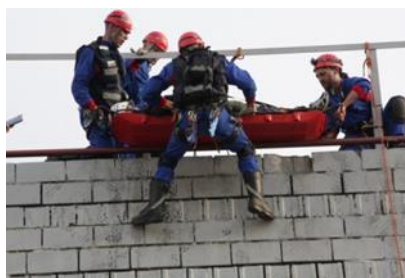
Figura 4: Equipo practicando una operación de rescate.

El ejercicio deberá ser diseñado haciendo uso de escenarios realistas de colapso estructural constantes y no deberá ser un ejercicio que demuestre habilidades técnicas individuales (es decir, organizar el ejercicio utilizando estaciones de rendimiento de habilidades preestablecidas). Además, el ejercicio de desastre simulado deberá aplicar todas las fases clave de respuesta internacional en casos de desastre.