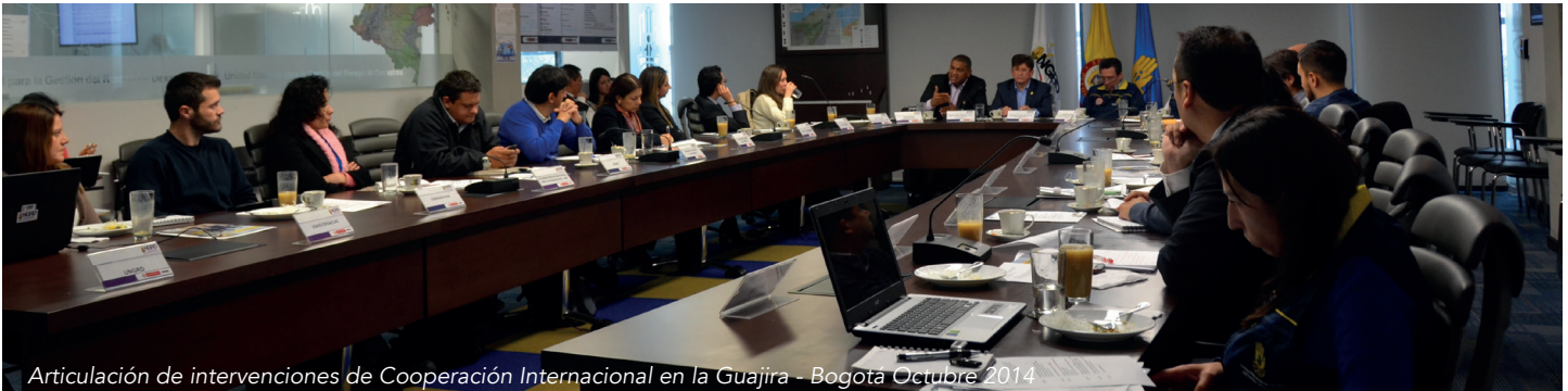
Articulación de intervenciones de Cooperación Internacional en la Guajira - Bogotá Octubre 2014