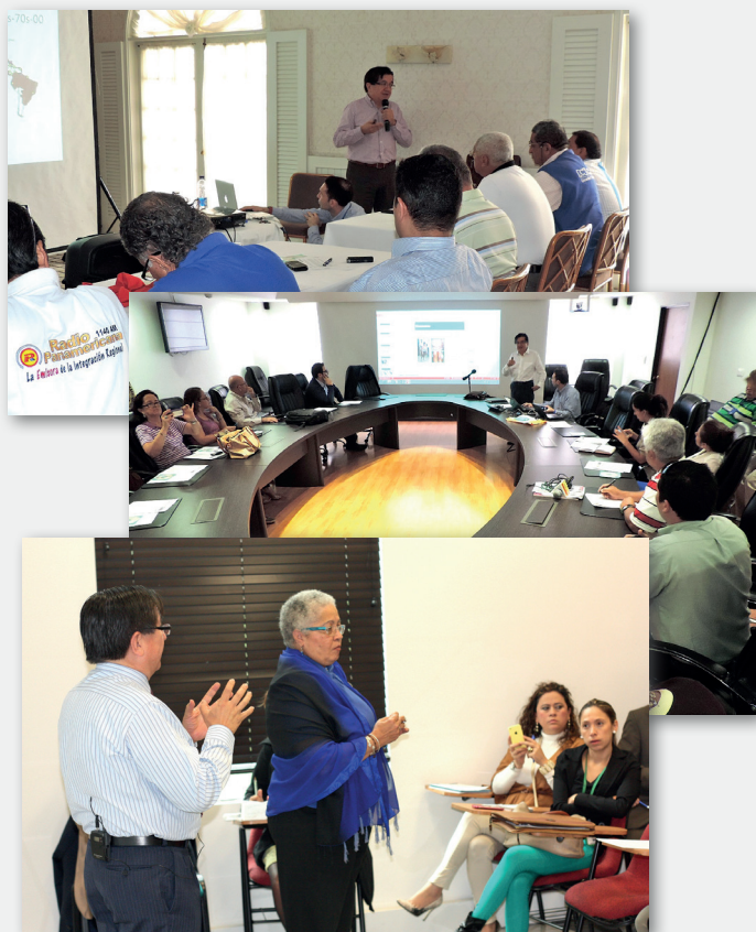
Gobierno capacita sobre el chikunguña a comunicadores.