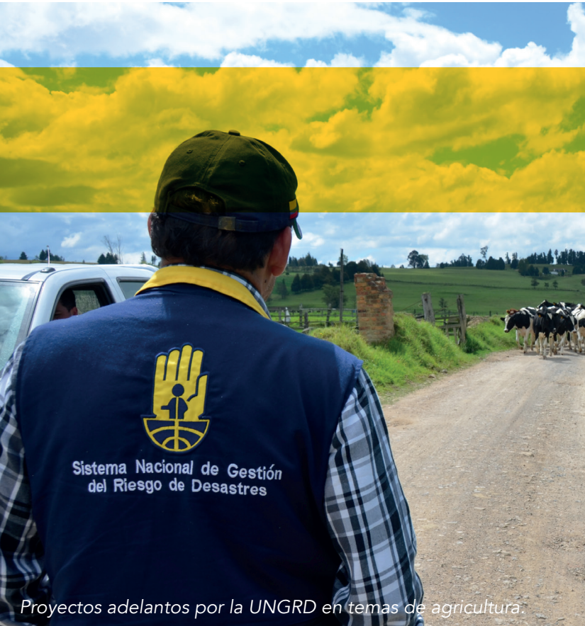
Proyectos adelantados por la UNGRD en temas de agricultura.