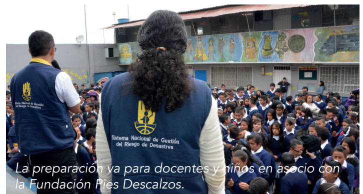
La preparación va para docentes y niños en asocio con la Fundación Pies Descalzos.

Adicional se trabajará en: la construcción de un material pedagógico dirigido a tomadores de decisión para fortalecer sus capacidades y competencias en materia de Gestión del Riesgo de Desastres; y a través de la Mesa de Gestión del Riesgo de Desastres del Sistema Nacional de Aprendizaje –SENA- en la normalización de competencias laborales en actividades de rescate.