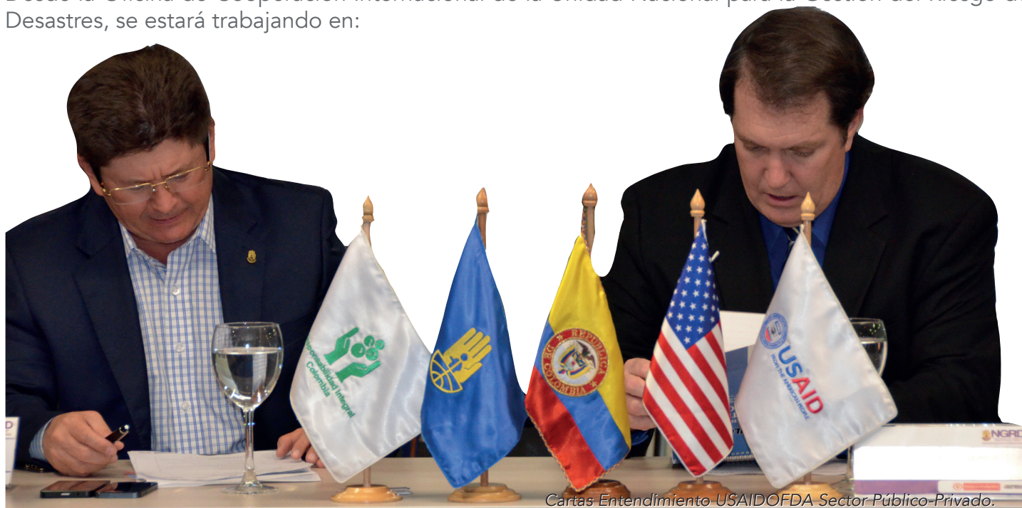
Cartas Entendimiento USAID/OFDA Sector Público-Privado.

Desde la Oficina de Cooperación Internacional de la Unidad Nacional para la Gestión del Riesgo de Desastres, se estará trabajando en: