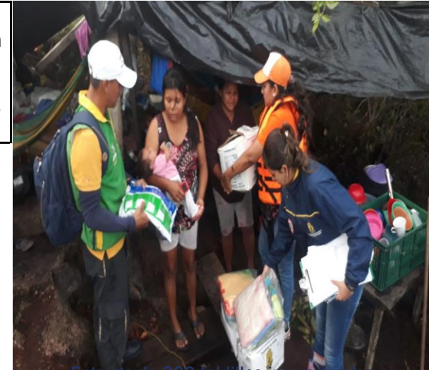
Entrega de 800 toallitos impregnados (Cumaribo Comunidades rio Guaviare Laguna cacao, Laguna Negra, San Luis La Rompada y Veraniego. )