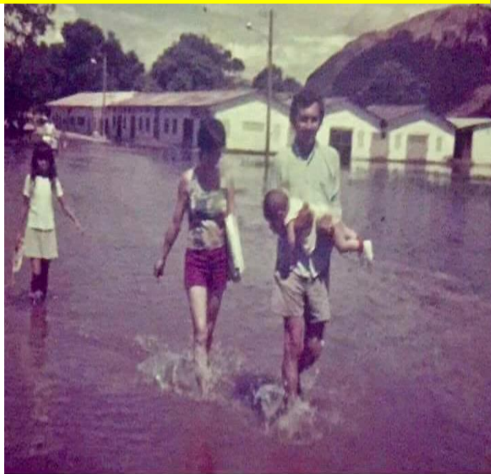
1976 Sector SENA