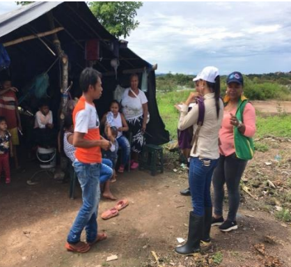
Vigilancia en Salud Pública, 309 personas beneficiadas (Puerto Carreño)