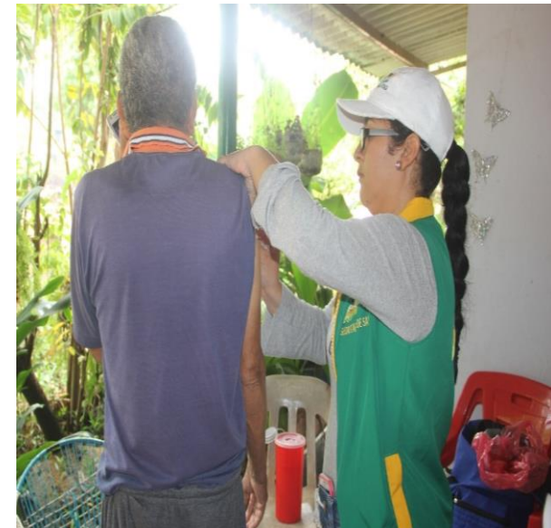
84 personas Inmunizadas (Puerto Carreño)