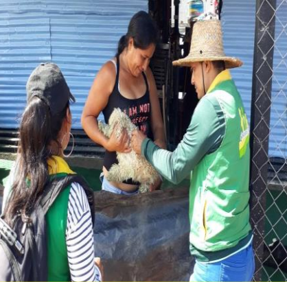
Vacunación antirrábica 1.432 animales inmunizados cobertura del 61% ( Puerto Carreño)