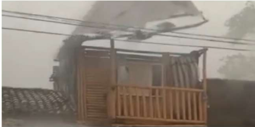
Imagen de video de vendaval que se lleva techo de vivienda en Cartago

Durante el temporal se presentó la caída de árboles en esta ciudad.