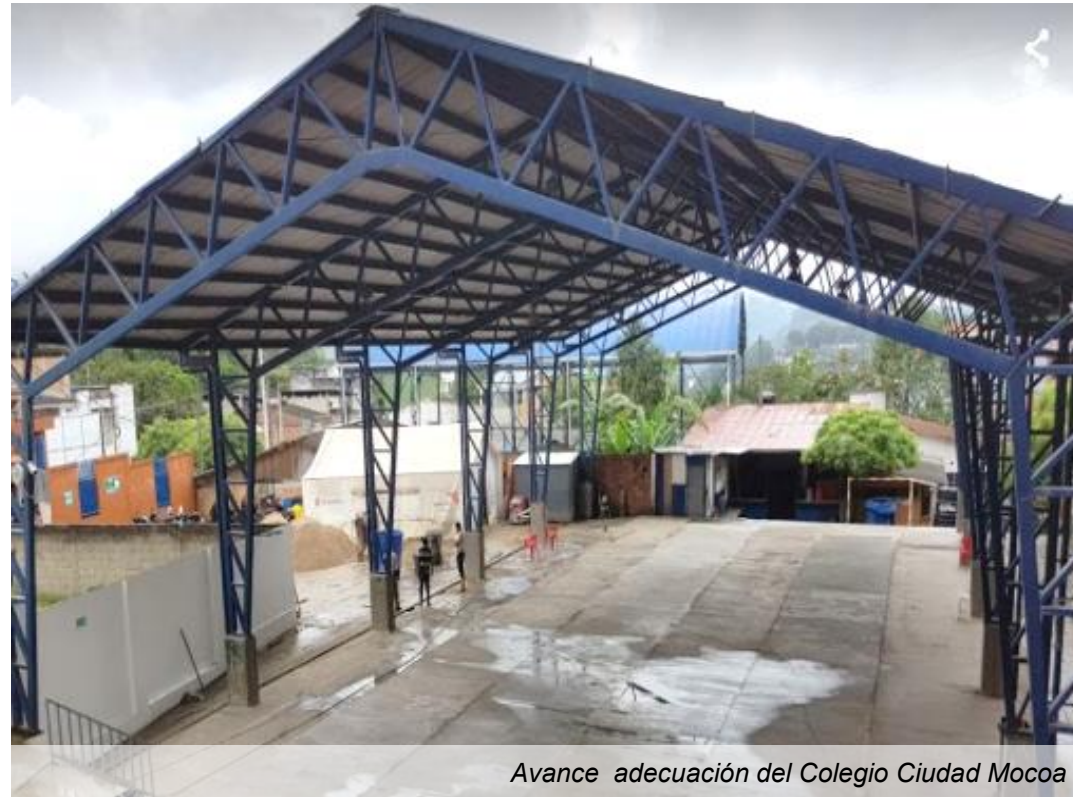
Avance adecuación del Colegio Ciudad Mocoa