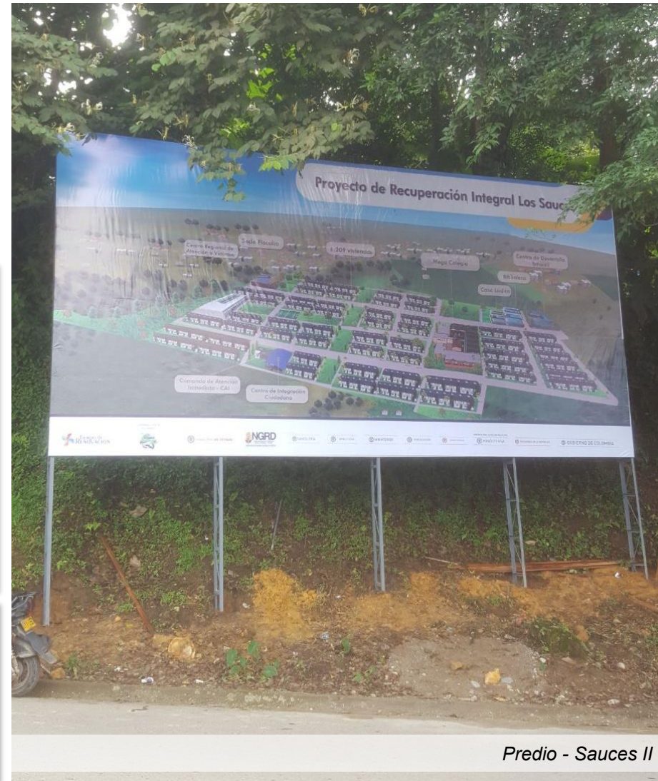
Predio - Sauces II