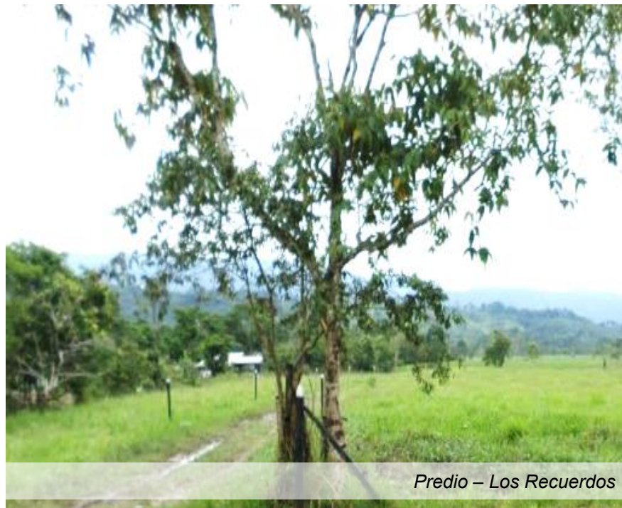
Predio – Los Recuerdos