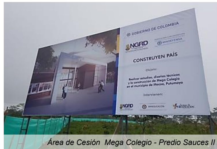
Área de Cesión Mega Colegio - Predio Sauces II