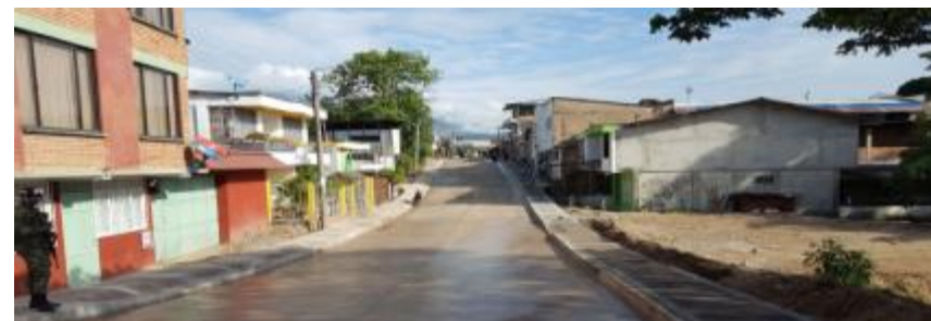
Vía Victoria Regia