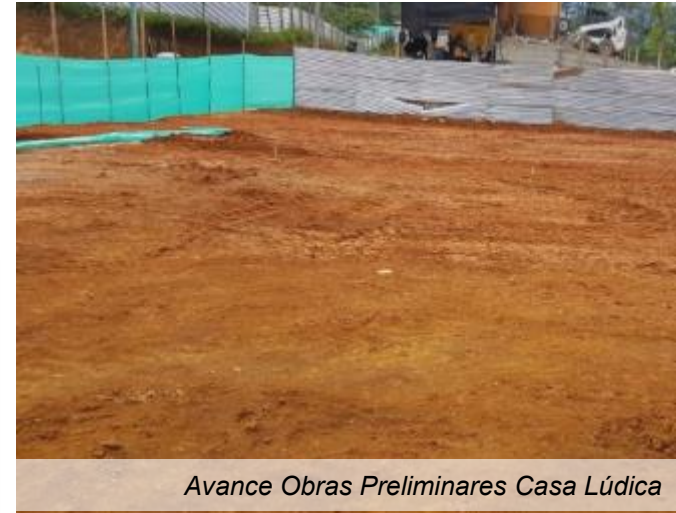
Avance Obras Preliminares Casa Lúdica