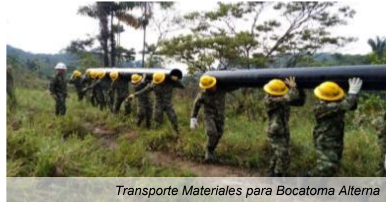
Transporte Materiales para Bocatoma Alterna