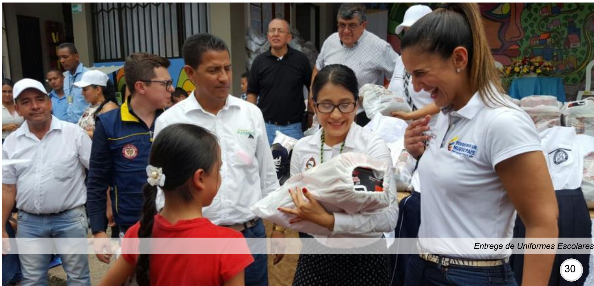
Entrega de Uniformes Escolares