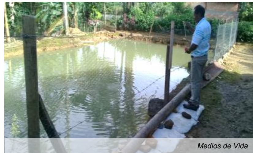
Medios de Vida