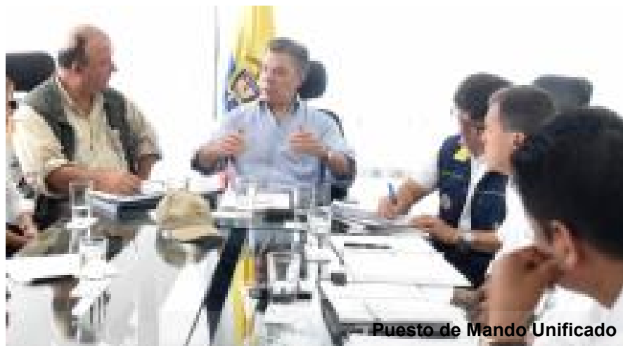
Puesto de Mando Unificado