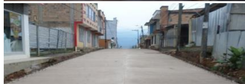
Avance intervención Vía La Brigada