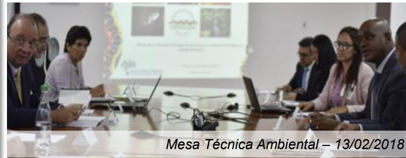
Mesa Técnica Ambiental – 13/02/2018