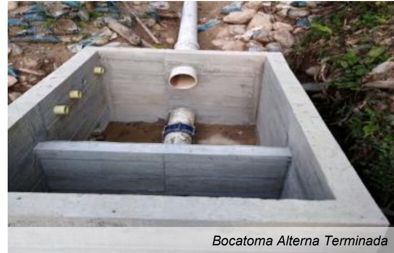
Bocatoma Alterna Terminada