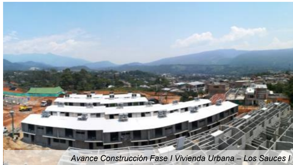
Avance Construcción Fase I Vivienda Urbana – Los Sauces I