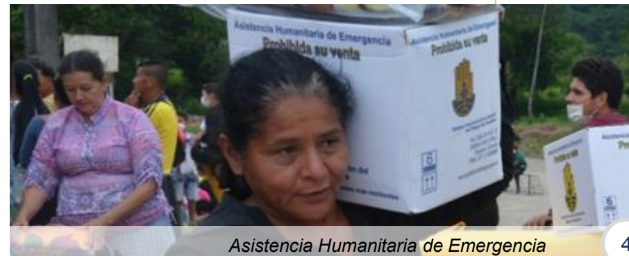
Asistencia Humanitaria de Emergencia