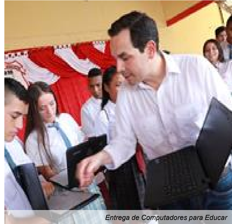
Entrega de Computadores para Educar