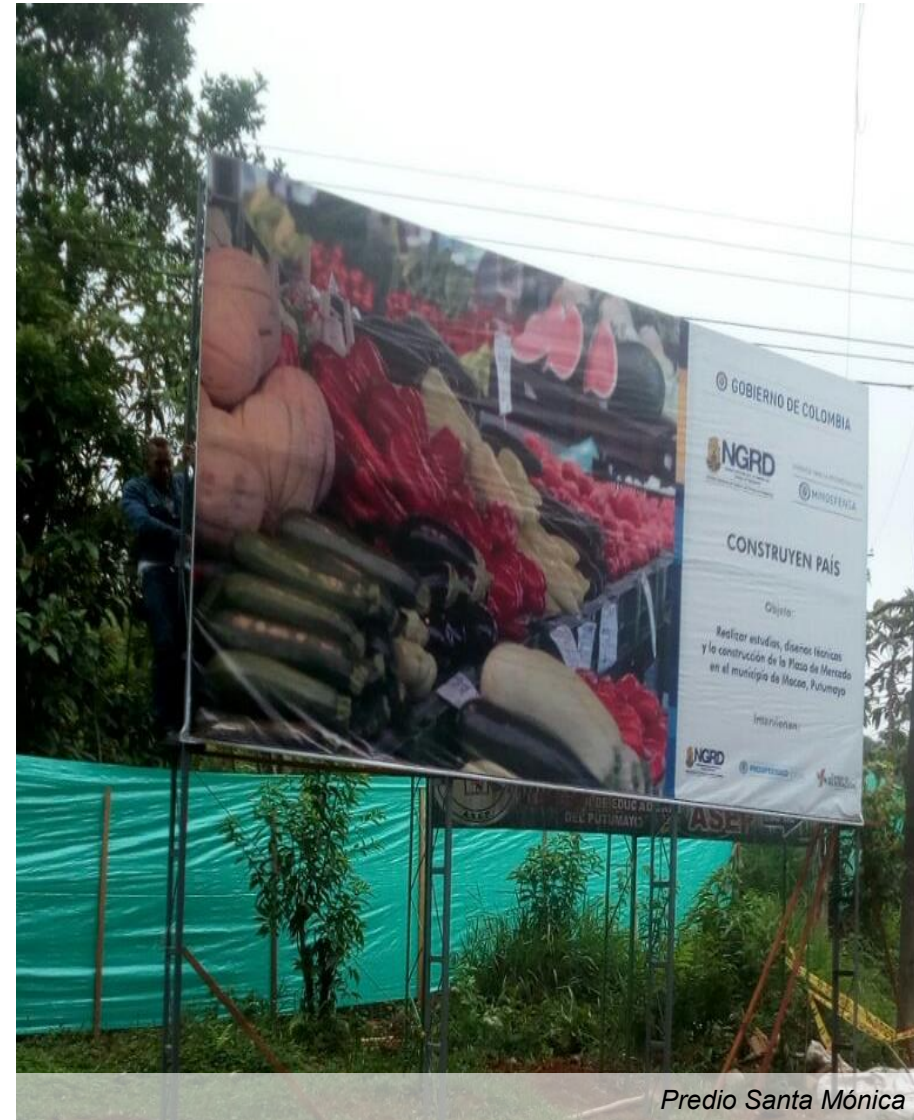
Predio Santa Mónica