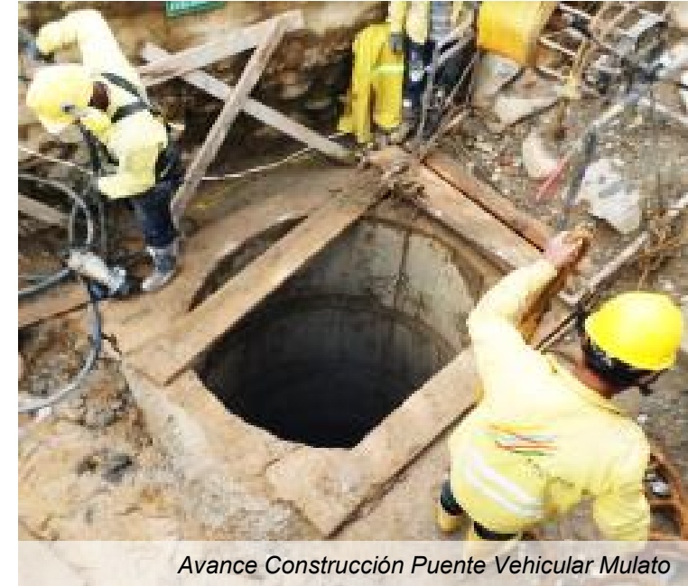
Avance Construcción Puente Vehicular Mulato