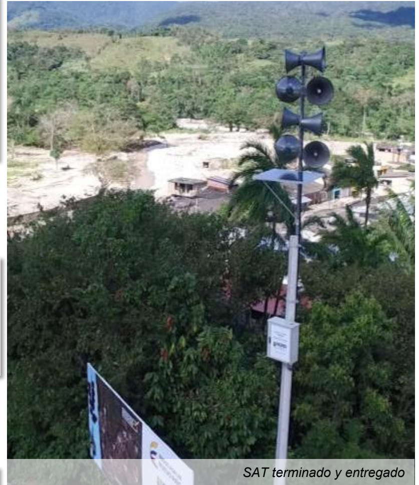
SAT terminado y entregado