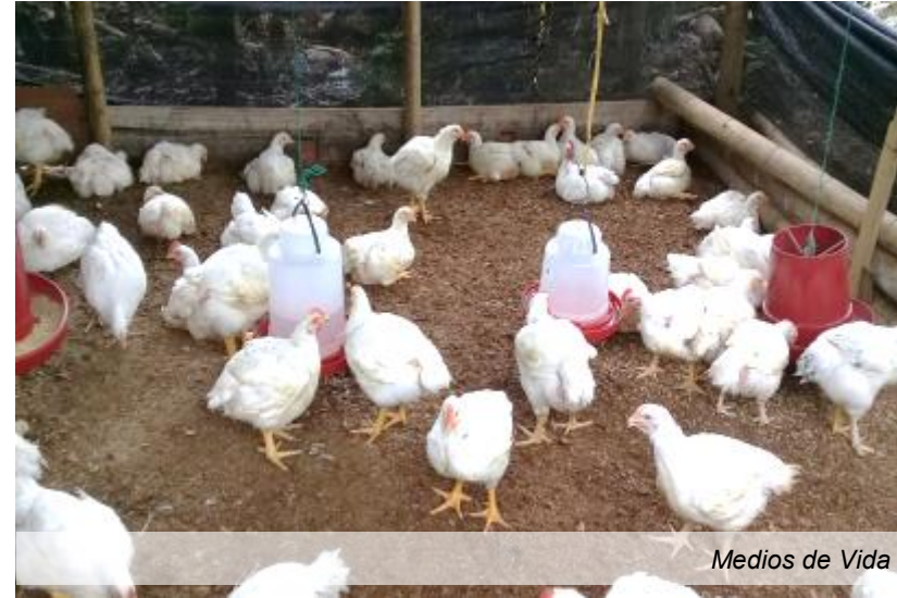
Medios de Vida