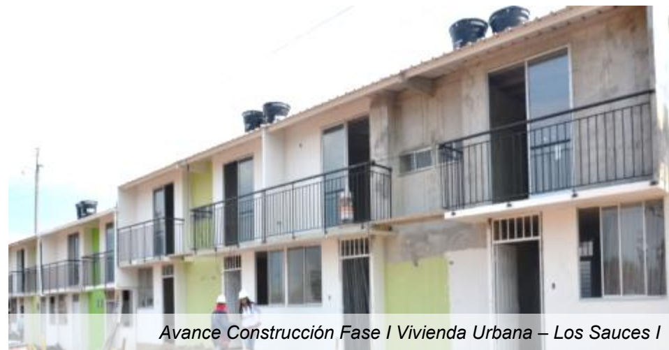
Avance Construcción Fase I Vivienda Urbana – Los Sauces I