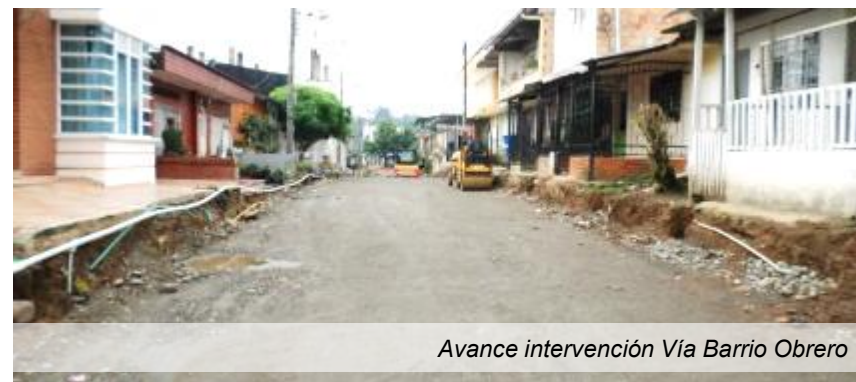
Avance intervención Vía Barrio Obrero