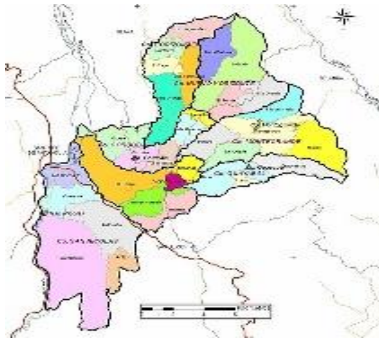
Mapa del Municipio de Sopetrán