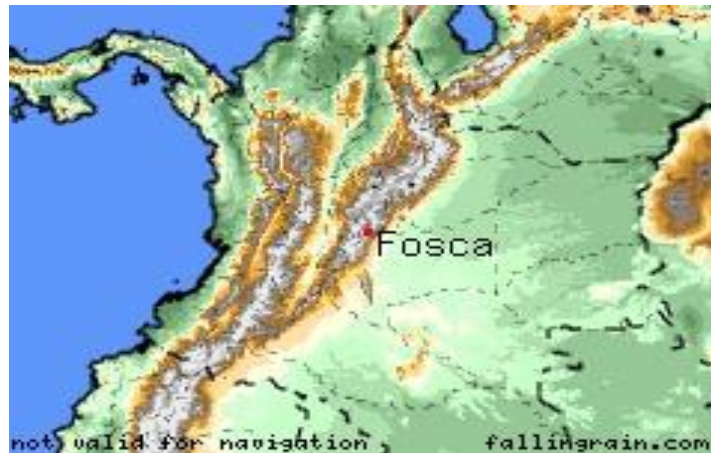
Municipio de Fosca en Colombia

En este formulario se consolida información básica para tener una aproximación a la dinámica municipal. A.1. Descripción general del municipio: localización geográfica, extensión, población (urbana y rural), altitud, descripción del clima (temperatura, periodos lluviosos del año), relieve, cuerpos de agua (rurales y urbanos), contexto regional: macrocuenca, región geográfica, municipios vecinos. A.2. Aspectos de crecimiento urbano: año de fundación, extensión del área urbana, número de barrios, identificación de barrios más antiguos, barrios recientes, tendencia y ritmo de la expansión urbana, formalidad e informalidad del crecimiento urbano, disponibilidad de suelo urbanizable. A.3. Aspectos socioeconómicos: pobreza y necesidades básicas insatisfechas, aspectos institucionales, educativos, de salud, organización comunitaria, servicios públicos (cobertura, bocatomas, sitio de disposición de residuos sólidos, etc.), aspectos culturales. A.4. Actividades económicas: principales en el área urbana y rural. A.5. Principales fenómenos que en principio pueden representar amenaza para la población, los bienes y el ambiente.