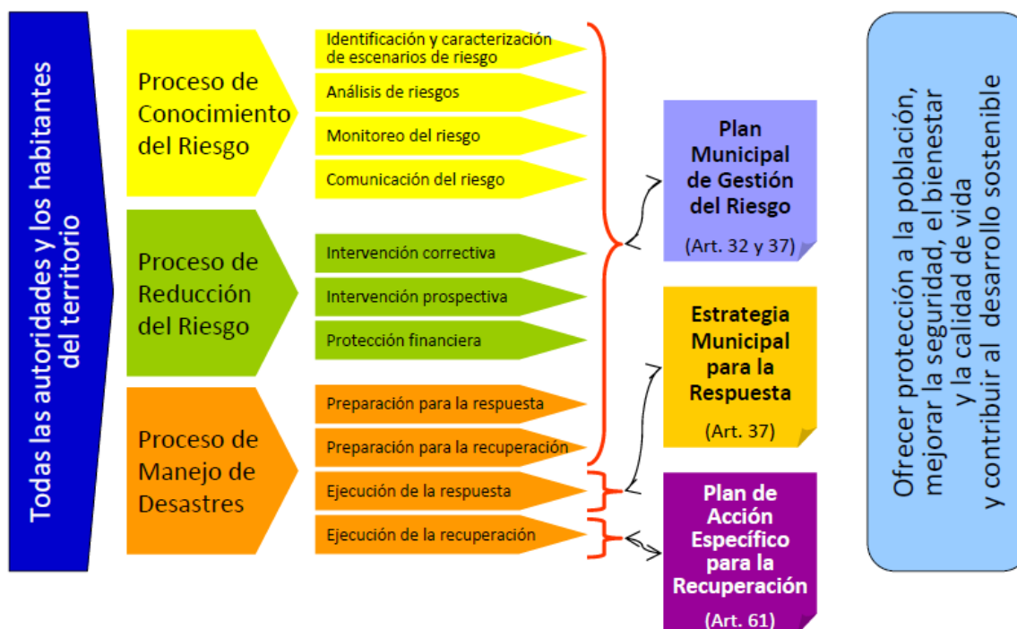
Figura 5. Relación entre los instrumentos de planificación creados por la Ley 1523 de 2012 y los procesos de la Gestión del riesgo

Nota: Los artículos citados se refieren a la Ley 1523 de 2012.