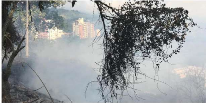
En cerros cercanos a Bucaramanga se han registrado conflagraciones.

En los últimos 15 días las llamas han consumido cerca de 55 hectáreas en varias poblaciones.