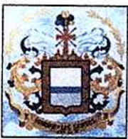
Municipio De Los Santos