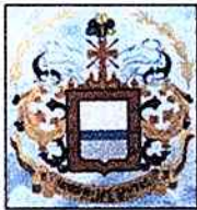
Municipio De Los Santos

Con el fin de fijar las estrategias a desarrollar y dar cumplimiento a lo dispuesto en la normatividad sobre análisis y reducción de riesgos, respuesta a emergencias y manejo de desastres y especialmente a las disposiciones de la Ley 1523 de 2012 " por medio de la cual se adopta la política nacional de gestión riesgo y desastres, y se establece el Sistema Nacional de Gestión del Riesgo y Desastre y se dictan otras disposiciones ", se expide el presente documento que contiene los lineamientos para