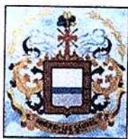
Municipio De Los Santos

La mayor amenaza existente por los antecedentes presentados; son los movimientos telúricos que se muestran de manera constante en el territorio santero, El último movimiento telúrico fuerte se presentó el 10 de marzo de 2015 de 6.6 grados en la escala de RICHTER dejando varias edificaciones averiadas y suelos agrietados, este evento genero alarma en las entidades quienes gestionaron las reparaciones de los daños causados por este fenómeno natural y alerta sobre posibles amenazas en sismos futuros.