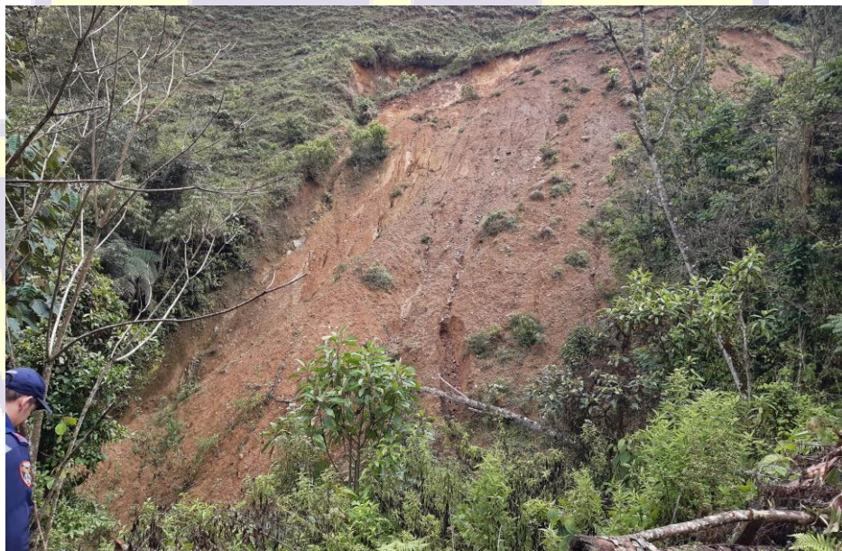
Figura 4. Deslizamiento. Finca El Porvenir.

El talud ubicado en la propiedad demostró un deslizamiento rotacional periódico -que ha ido en aumento- y presenta transformaciones del suelo en forma de cárcavas y escarpes en dirección hacia abajo del talud, donde se encuentra una quebrada que pasa por terrenos de fincas aledañas. El suelo del terreno es de tipo grava-arcilloso, dejando en evidencia material rocoso y vegetal que ha sido arrastrado.