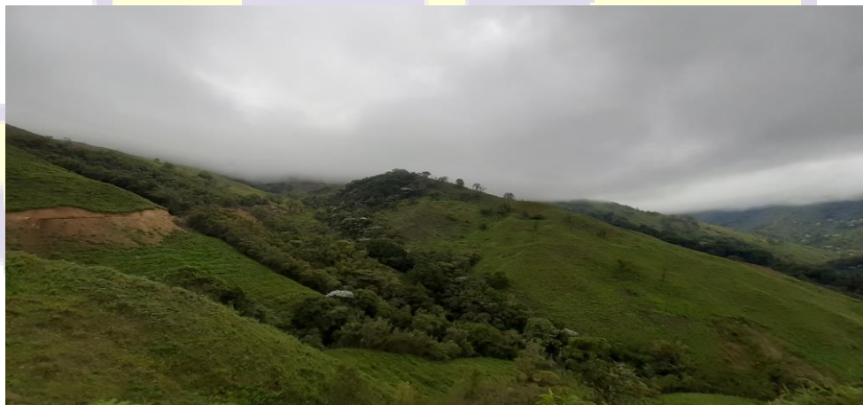
Figura 1 Tramo vereda San Juan Alto.