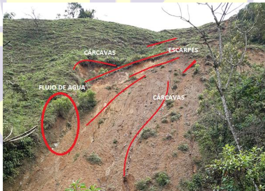
Figura 6. Escarpes, cárcavas y flujo de agua existente en la ladera. Finca El Porvenir.

Así mismo, se identificó que existe un flujo de agua superficial en el talud, el cual, puede influir en la inestabilidad del mismo, ya que cualquier presencia de un flujo hídrico tiene afectación en el suelo por su capacidad de soporte en términos de saturación. Esto quiere decir que, cuando un suelo sobrepasa su capacidad de retener agua -como pasa usualmente en suelos de tipo arcilloso que tienen alta capacidad de retención, pero al entrar en contacto con esta se vuelve inestable su estructura- este pasa a sufrir eventos de erosión y eventualmente, desprendimiento.