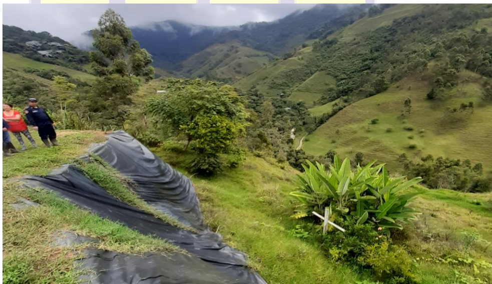
Figura 2. Obra de mitigación. Finca La Ilusión.

Se observó una pendiente dentro del terreno que actualmente se encuentra intervenida. En el año 2018 una parte del predio fue afectada a causa de un deslizamiento de tierra que afectó el terreno, modificando el paisaje natural del mismo. La obra que se muestra en la figura 2, se realizó con el objetivo de mitigar y reducir el riesgo de posibles nuevos casos de deslizamiento de tierra en el talud. Actualmente el estado del talud es estable, no se han registrado eventos por remoción o desprendimiento del talud.