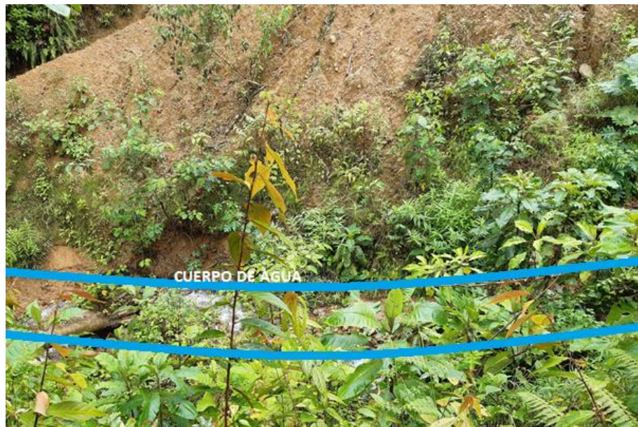
Figura 5. Cuerpo de agua abajo del deslizamiento. Finca El Porvenir.