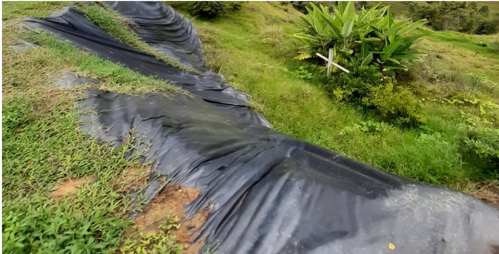
Figura 3. Obra de mitigación. Finca La Ilusión. (2)