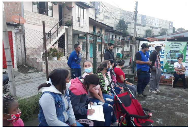
Comunidad del barrio Salvador Allende.