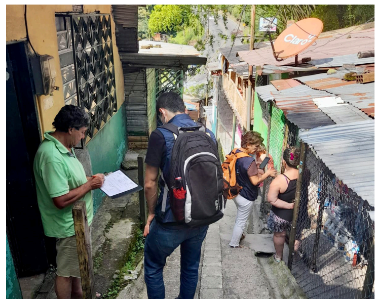
Capacitación en el barrio Buenos Aires Bajo sobre los vendavales y la temporada de lluvias.