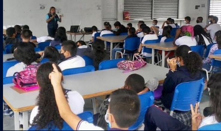
Capacitación en la Institución educativa La Cecilia sobre los factores de riesgo que afectan la ciudad, como los sismos, deslizamientos, vendavales y volcán Cerro Machín.