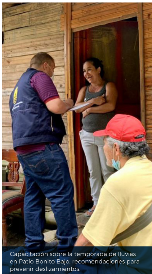
Capacitación sobre la temporada de lluvias en Patio Bonito Bajo, recomendaciones para prevenir deslizamientos.