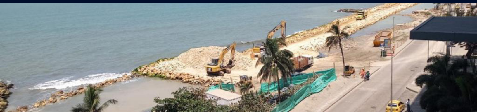
Construcción del espolón 2 que tendrá una longitud de casi 1.000 metros.

El 5 de febrero se completó la 1ª etapa de la fase 1 componente 1 del proyecto, una intervención que se desarrolló entre el monumento Unión de los océanos hasta el Baluarte de Santo Domingo, en donde se realizó la construcción de la protección marginal. Esta fase o primer tramo se ejecutó en 40 días y se intervinieron allí 460 metros lineales disponiendo de un ancho de entre 16 y 18 metros a través de la inserción de 22.000 m 3 de roca.