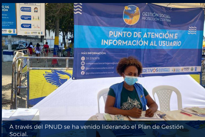
A través del PNUD se ha venido liderando el Plan de Gestión Social.