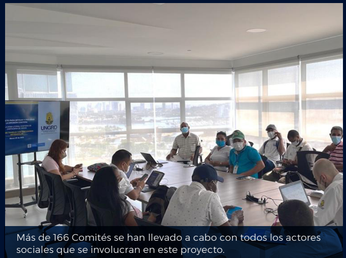
Más de 166 Comités se han llevado a cabo con todos los actores sociales que se involucran en este proyecto.