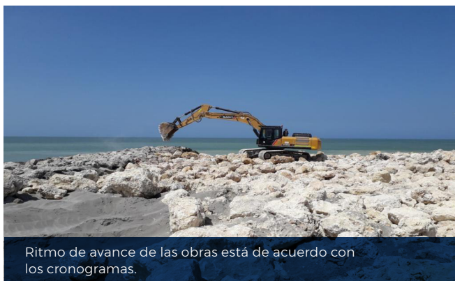
Ritmo de avance de las obras está de acuerdo con los cronogramas.

A través de los programas, capacitaciones, seguimiento y monitoreo ambiental realizado con la comunidad, se busca posicionar el proyecto de Protección Costera en Cartagena frente a la opinión pública y a los beneficiarios, así como las obras, las cuales reducirán el riesgo de erosión e inundación asociados al cambio climático, de conformidad con la Agenda 2030 sobre el Desarrollo Sostenible, ofreciendo así mayores capacidades para la seguridad, el bienestar y la calidad de vida de todos los Cartageneros.