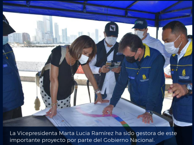
La Vicepresidenta Marta Lucía Ramírez ha sido gestora de este importante proyecto por parte del Gobierno Nacional.