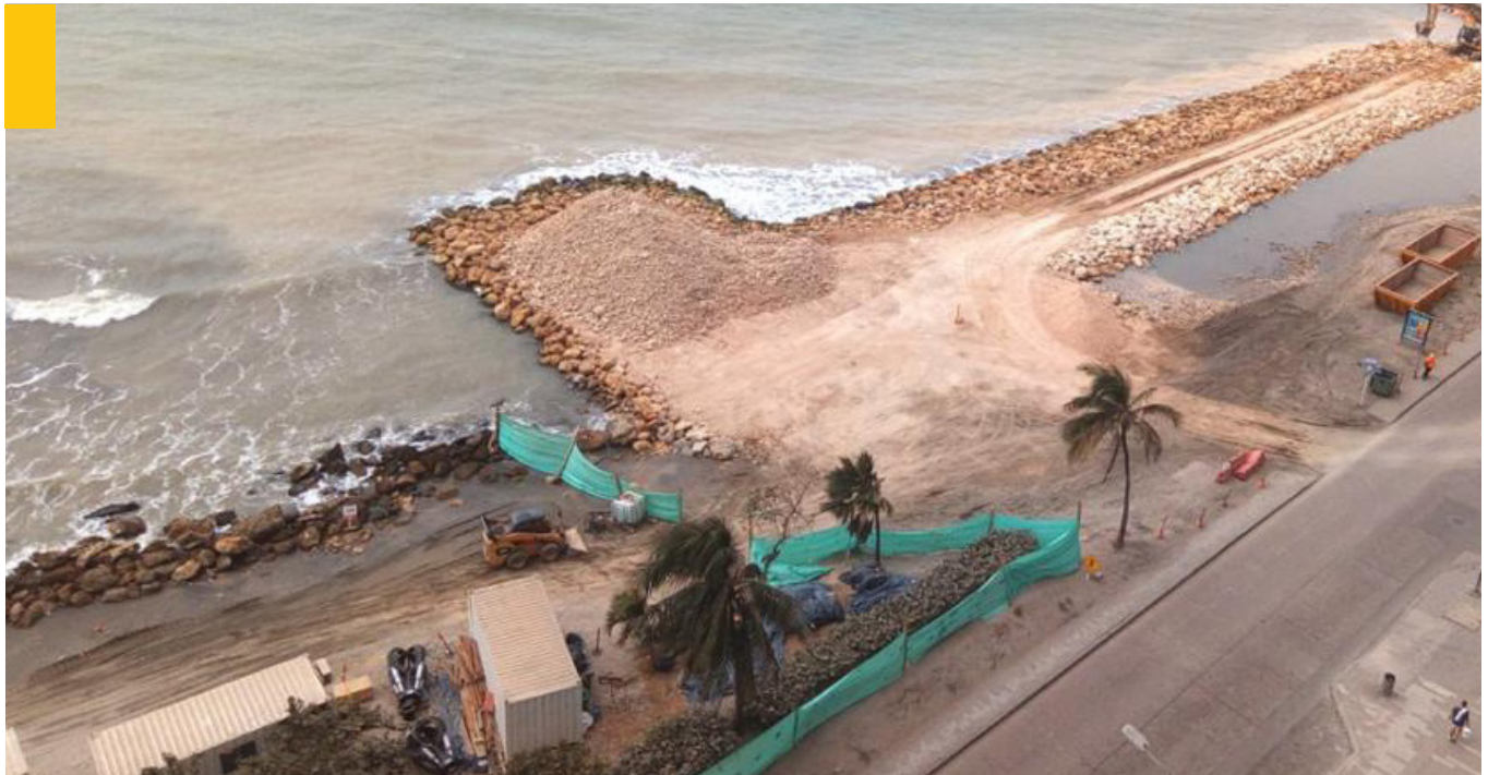
Más de 4.5 km de costa serán intervenidos en todo el Proyecto de Protección Costera en Cartagena.