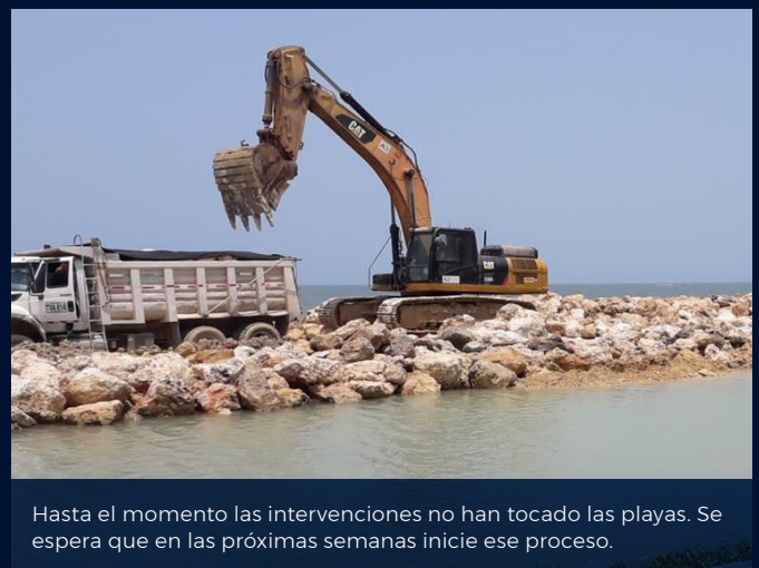
Hasta el momento las intervenciones no han tocado las playas. Se espera que en las próximas semanas inicie ese proceso.