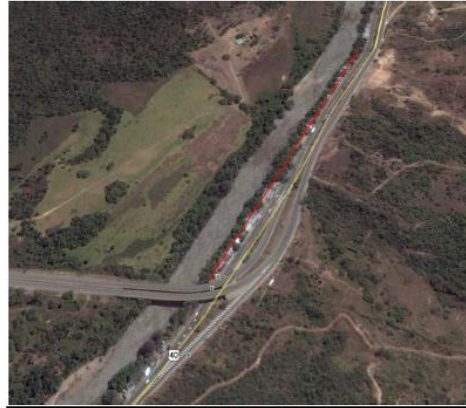
Fotografía 23. Imagen de satélite que presenta la socavación lateral del río Sumapaz en el sector de la Colorada.

En este sector se observa amenaza alta y media por inundación presentando fenómenos de desbordamientos y procesos por socavación ya que allí afloran rocas del grupo Gualanday; estos procesos de inundación se presentan con intervalos no muy amplios, por el río Sumapaz, que afecta el sector.