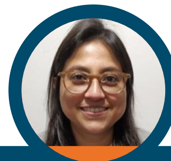
ELSA SÁNCHEZ GÓMEZ 1*

Por último, se resaltarán algunos de los avances sub-sectoriales que de manera directa e indirecta incorporan la gestión de riesgos tecnológicos como NATECH desde instrumentos normativos, guías y otras iniciativas.