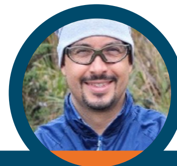
JAIME ARISTIZÁBAL CEBALLOS 1*

De esta manera se ha consolidado una estrategia que ha permitido generar una tendencia de reducción sostenida en el tiempo de fallas de integridad debidas a geoamenazas por cuanto: permite la integración de información de diferentes disciplinas en función de las condiciones del entorno en donde se efectúa la operación, relaciona factores contribuyentes y detonantes de geoamenazas en su interacción con la infraestructura, y prioriza espacial y temporalmente los planes de mantenimiento.