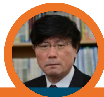
NORIO OKADA 1*

Los cuatro autores ofrecen una variedad de perspectivas y esperamos que haya una discusión más amplia entre los asistentes a la conferencia.