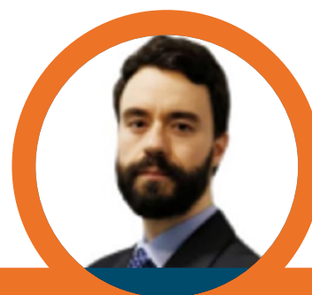
RAFAEL AMAYA GÓMEZ 1*

Presenta además una propuesta hecha por los autores cuando se contempla además un proceso por corrosión que reduce el espesor de la pared de la tubería y la hace más vulnerable a una falla. Contemplar este tipo de riesgos Natech en Colombia es una necesidad al ser un país con diferentes amenazas de origen natural no solo geológicas, que pueden afectar significativamente a las personas, el medio ambiente y la continuidad del negocio.