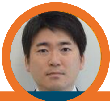
TOMOAKI NISHINO 1*

Takuya Miyashita 1 , Nobuhito Mori 1 & Mizuki Nakano 1