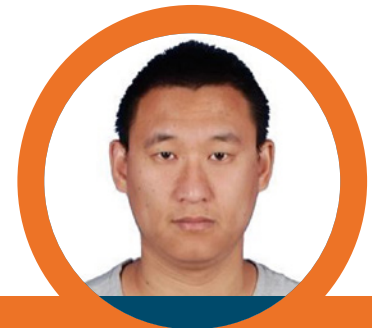
XIAOLONG LUO 1*

Se espera que este trabajo contribuya al seguimiento del riesgo y la evaluación de eventos Natech relacionados con la hidrometeorología y proporcione información útil a los tomadores de decisiones para desarrollar estrategias de reducción de riesgos Natech.