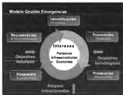
Grafico 1. Modelo Gestión Emergencias

Una propuesta a considerar acorde con lo planteado por la UNGRD es el Modelo de Gestión de Emergencias que contempla acciones de prevención (este modelo involucra en este punto acciones de mitigación), “Reducción” preparación, acciones para la atención de la emergencia “Respuesta” o el evento adverso y todas las acciones para la Recuperación”.