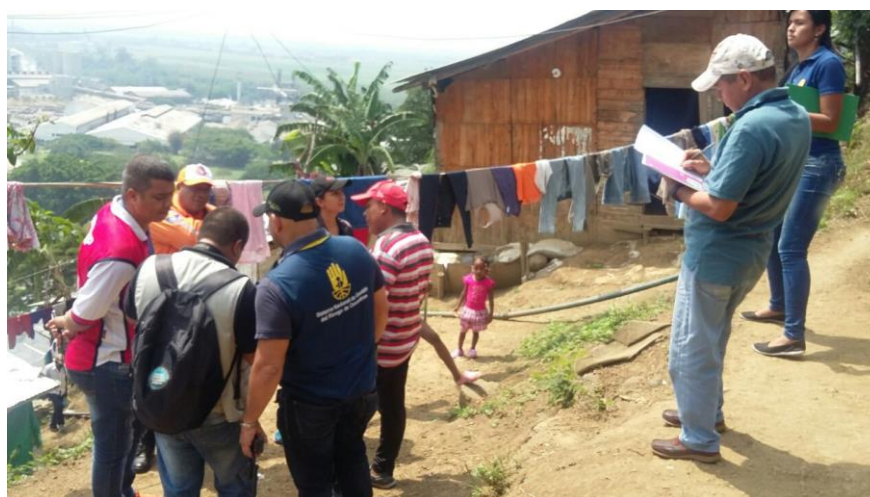
Los Consejos Departamentales y Municipales de Gestión del Riesgo apoyan labores en todo el país

Bogotá, 11 de abril de 2016. (@UNGRD.) Los departamentos de Chocó, Valle del Cauca, Cauca, Nariño, Antioquia, Risaralda, Caldas, Quindío, Santander, Norte de Santander y Cundinamarca son propensos a registrar crecientes súbitas.