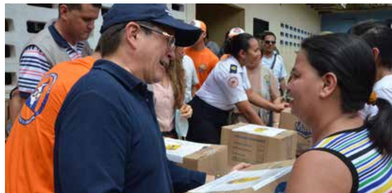
La entrega de Ayuda Humanitaria de Emergencia se ha hecho para las 1.700 familias.

En la actualidad se encuentran dos retroexcavadoras sobre oruga, una camabaja, dos retroexcavadoras sobre llantas y tres volquetas sencillas, trabajando en la región.