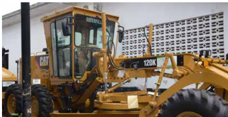
La maquinaria amarilla está trabajando en las vías de la región.