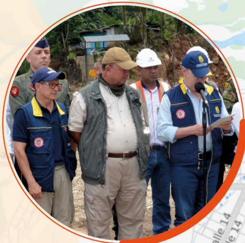
Presidente de la República, Juan Manuel Santos Calderón, dio apertura vía que conecta a Mocoa con interior del país a través de Puente Militar.