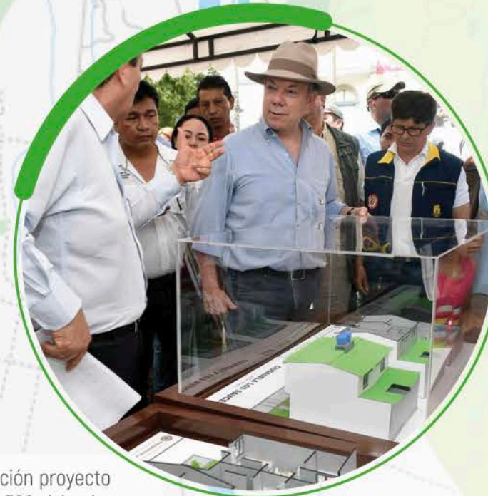
Presentación proyecto primeras 300 viviendas.