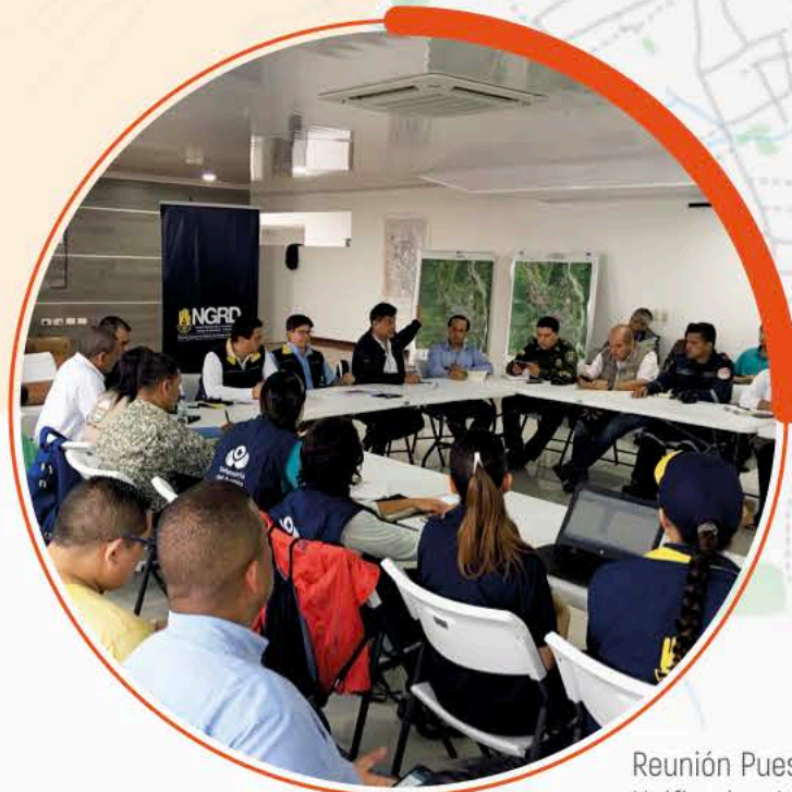
Reunión Puesto de Mando Unificado - Mocoa