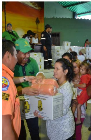
Un SNGRD actuando

· Van 62 eventos en el territorio nacional por las lluvias.